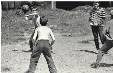
Игра в выбивалы во дворе, 1980-е годы 25