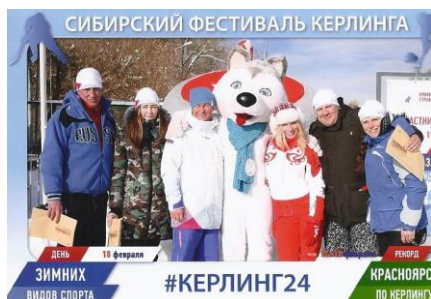
Один из социальных плакатов Сибирского фестиваля керлинга, февраль 2017 г.

18 – 19 февраля в Красноярске прошёл финал Всероссийской дворовой лиги керлинга, в котором сыграло 10 лучших команд из 8 регионов страны. Победителем финального турнира стала команда Красноярского края, вторыми стали представители Омской области, третьими – республики Хакасия.