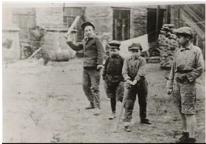
Дети играют в городки, 1930-е годы

Все выдающиеся советские (да и многие российские) спортсмены, олимпийские чемпионы и чемпионы мира – выходцы из дворового спорта. Именно во дворе начиналось их знакомство с миром спорта, именно на площадках по месту жительства выковывалось их спортивное мастерство. Таким образом, вывод о том, что любой шаг в мир большого спорта начинается во дворе, является своего рода социально-спортивной аксиомой.