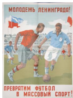
Наглядные плакаты о здоровом образе жизни 1930-х годов