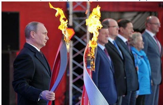
Президент РФ В.В. Путин с олимпийским огнём Олимпиады в Сочи-2014 63