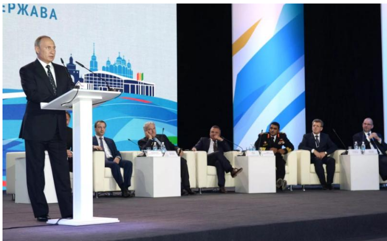
Выступление В.В. Путина на пленарном заседании Форума «Россия – спортивная держава» в Коврове, 11 октября 2016 г.

В своём выступлении на Форуме «Россия – спортивная держава» в Коврове 11 октября 2016 года, Президент Российской Федерации В.В. Путин отметил: «Мы будем, безусловно, приветствовать тех, кто берёт на себя заботу и ответственность по созданию дворовых команд, развитию школьного и студенческого спорта, проведению различных соревнований; будем, безусловно, поддерживать физкультурно-спортивные организации и возрождение движения ГТО» 5 .