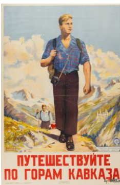
Наглядные плакаты о здоровом образе жизни 1950-х годов