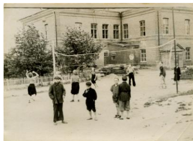
Дворовый волейбол в городе Венева Тульской области, 1960-е годы 12

Значительное влияние на развитие и поддержку массового спорта оказало Постановление комитета по физической культуре и спорту при Совете Министров СССР от 30 июня 1971 года «Об утверждении положения о судьях по спорту и судейских коллегиях». Это постановление создало основы для самого широкого привлечения судей к организации и проведению массовых соревнований, а также облегчило вступление любителей спорта в эту почётную спортивную категорию. Так, были установлены следующие категории судей: юный судья (12 – 16 лет); судьи III, II и I категории; судья республиканской категории, всесоюзный судья. Подобная система позволила не только проводить соревнования самого низшего уровня, но и делать их