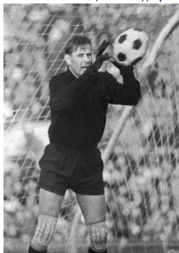
Инициатор турнира «Кожаный мяч» Лев Яшин

С инициативой о проведении массового футбольного соревнования для любительских команд впервые выступил советский вратарь Лев Иванович Яшин ещё в самом начале 1960-х годов, но идея дождалась своей реализации на уровне страны несколько лет. Идея получила поддержку в ЦК ВЛКСМ, и в 1964 году соревнования состоялись впервые.