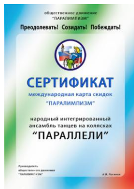
Сертификат карты скидок «Паралимпизм», декабрь 2010 г.

Люди с ограниченными возможностями могут не только сами участвовать в посильных спортивных состязаниях и заниматься в группе какой-либо компенсаторной двигательной активностью. Они могут помогать судить дворовые соревнования, быть судьями, секретарями и организаторами. Автору представляется, что взаимный эффект пользы будет огромным, если человек с ограниченными возможностями возьмёт на себя функции координатора дворового движения у себя во дворе, на улице или микрорайоне, равно как и внимание соседей к нему не будет лишним.