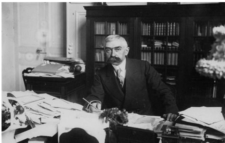
Основатель олимпийского движения барон Пьер де Кубертен

Логинов А.И. Социальный дворовый спорт: краткие ответы на популярные вопросы. Инструкция к социальному спорту обратиться к первоисточникам – наследию великого гуманиста и педагога, основателю олимпийского движения Пьеру де Кубертену.