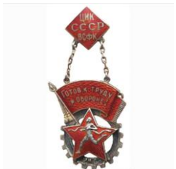
Знак «Готов к труду и обороне», 1930-е годы

С начала 1930-х годов в стране получила распространение такая форма массовых спортивных мероприятий как праздник День физкультурника – как уже отмечалось, физкультуре и спорту уделялось повышенное внимание. Стали регулярно проводиться физкультурные парады – как всесоюзные, так и на уровне уездных городов и даже крупных сельских центров. Они способствовали не только организации физкультурного движения, но и популяризировали его в массах. В институтах открывались физкультурные факультеты, а позднее целые учебные заведения стали готовить профессионалов-педагогов для всесторонней подготовки будущих физкультурников-универсалов. Не менее активно разрабатывались и внедрялись программы физического воспитания детей в школах.