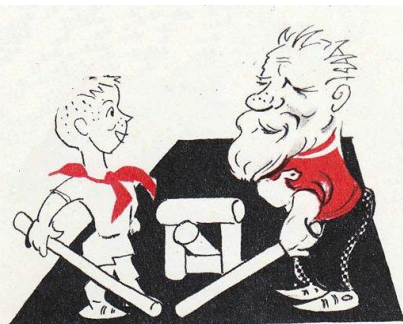
Рисунки из журнала «Спортивные игры» 1964 и 1968 г., пропагандирующие дворový спорт

В начале 1970-х годов на страницах «Комсомольской правды» была развернута целая серия публикаций, в которых рассматривались различные стороны спорта во дворе. Двор чётко понимался как место необходимой социальной работы – отсутствие занятости по месту жительства чётко понималась как причина асоциального поведения советской молодёжи, что вело к снижению человеческого потенциала и капитала советского общества 8 .