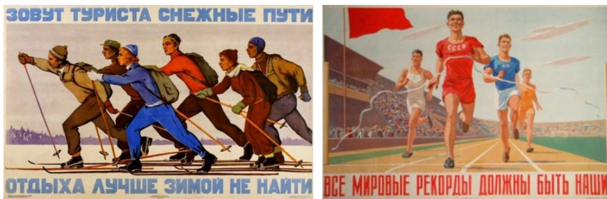
Наглядные плакаты о здоровом образе жизни 1950-х годов

Работать, строить и не ныть! Нам к новой жизни путь указан. Атлетом можешь ты не быть, Но физкультурником – обязан!