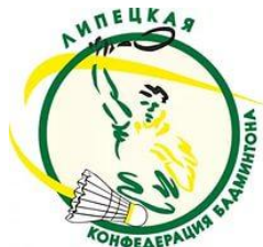
Эмблема Липецкой конфедерации бадминтона