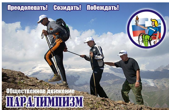
Рекламный плакат движения «Паралимпизм», декабрь 2009 г.

В применении к социальному дворовому спорту паралимпизм рассматривается как механизм активного и непосредственного участия в социализации, физической реабилитации и развитии людей с ограниченными возможностями по месту жительства. В действительности, безбарьерная среда будет такой не тогда, когда у нас будут повсеместно пандусы, но тогда, когда люди с ограниченными возможностями не будут стесняться спускаться на колясках хотя в собственные дворы, и им будут помогать их же соседи. У нас принято считать, что доступность спортивных объектов для инвалидов включает в себя такое понятие, как их оснащение специальным спортивным инвентарём, оборудованием, другими техническими средствами. На самом деле главное безбарьерное средство – человеческое участие.