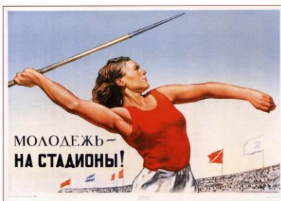
Наглядные плакаты о здоровом образе жизни 1930-х годов