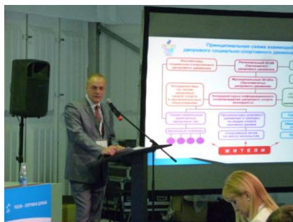
Концепция Всероссийского олимпийского движения была представлена на Форуме «Россия – спортивная держава», 11 октября 2017 г.