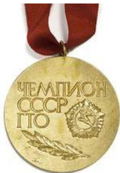
Медаль чемпиона СССР по ГТО

С 1974 года проводился чемпионат СССР по многоборью комплекса ГТО на призы газеты «Комсомольская правда». В этом соревновании разыгрывалось первенство в четырёх возрастных категориях: 14 — 15 лет, 16 — 18 лет, 19 — 28 лет, 29 — 39 лет (мужчины) и 29 — 34 года (женщины). В двух взрослых возрастных категориях в программу входили: бег на 100 м, метание гранаты, стрельба, плавание на 100 м, легкоатлетический кросс на 3000 м (мужчины) и 1000 м (женщины). Наиболее титулованная участница подобных соревнований, 9-кратная чемпионка СССР Наталья Богословская была удостоена звания «заслуженный мастер спорта».