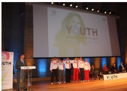
Участники паралимпийского велопробега в зале заседаний ЮНЕСКО во время Международного форума, 21 октября 2011 г.

Благодарю Вас за внимание! Присоединяйтесь к нам! Приезжайте к нам в гости в Россию и в Липецк! 71 .