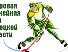
Эмблема Дворовой хоккейной лиги Липецкой области