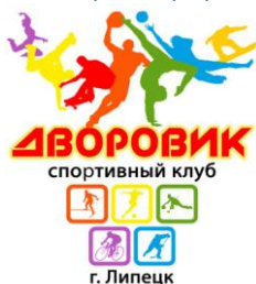
Эмблема СК «Дворовик» (Липецк)