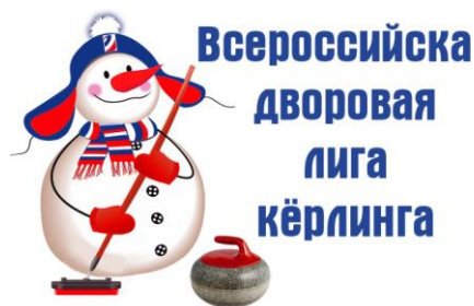
Эмблема Всероссийской лиги дворového керлинга

Шушенском до севера с центром в Дудинке). Дворовые лиги созданы в 12 муниципальных образованиях края, их основу составляли территориальные дивизионы по 8 команд в каждом. Всего в соревнованиях Дворовой лиги керлинга Красноярского края приняло участие 372 команды, из которых 298 представляли районы края. В матчах лиги 2016/2017 года приняло участие не менее 1488 человек различного возраста, а в ходе сезона в различных населённых пунктах, включая села, было проведено 14 специализированных мастер-классов по обучению игре в керлинг. Следует отметить, что финансирование соревнований лиги осуществлялось из средств Федерации керлинга Красноярского края, личных средств общественников, спонсорских средств.