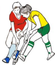
Эмблема Липецкой дворовой лиги хоккея на траве