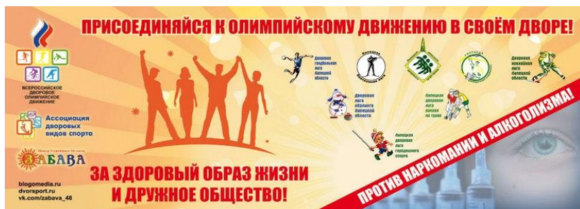
Антинаркотический баннер Ассоциации дворовых видов спорта, используемый на спортивных мероприятиях, 2015 г.

Учитывая важнейшее социальное значение социального дворового спорта и его непосредственное социальное влияние на национальную безопасность страны, компетенция принятия важнейших решений в этой сфере должна находиться в зоне государственных решений первого лица государства и основываться на специализированных государственных межведомственных программах, снижающих риск социального геноцида в отношении социального дворового спорта в муниципальных образованиях со стороны субъектов социальных отношений и обладателей управленческих решений, подпадающих под определение «социального убийцы».