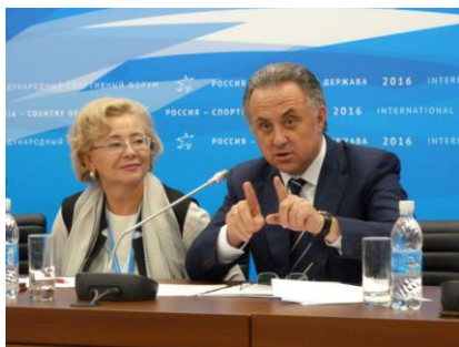
К теме развития дворового спорта было привлечено внимание министра спорта РФ В.Л. Мутко на пленарном заседании Форума «Россия – спортивная держава»

В октябре 2016 года концепция всероссийского дворового олимпийского движения была представлена на международном Форуме «Россия – спортивная держава», который прошёл во Владимирской области.