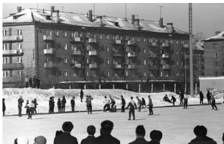
Хоккей с мячом в одном из спальных районов Ярославля, 1960-е годы 11

В первом розыгрыше турнира за победу боролись около 170 тыс. команд (почти три миллиона юных футболистов со всех республик Советского Союза). С этого момента турнир стал регулярным и проводится каждый год без исключений и в настоящее время. Так, в 2016 году Всероссийских соревнований по футболу назывались «Кожаный мяч – Кубок Coca-Cola».