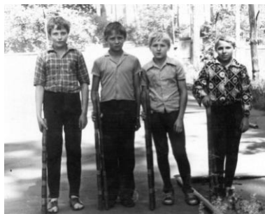
Подростки из общественной городошной секции г. Липецка, 1985 г. 26

В заключительном слове председатель областного спорткомитета А.Т. Добрынин отметил, что нужно направить работу нового состава на оказание помощи в работе с подразделениями ЖКХ при комнатах домоуправлений, в строительстве площадок в микрорайонах, оказание помощи в занятиях с населением. К сожалению, следует признать эти выводы дежурным бюрократическим штампом, никак не отразившемся на понимании происходящих процессов и попытке их изменить.