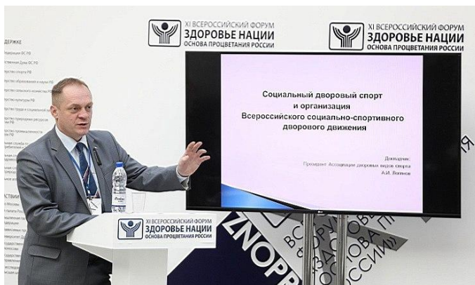
Выступление автора на XI Всероссийском Форуме «Здоровье нации – основа процветания России», 19 апреля 2017 г. 58