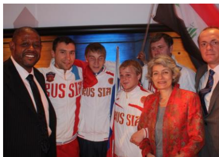
Участники велопробега с Генеральным секретарем ООН Ириной Боковой, 21 октября 2011 г.