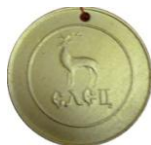
Медали Летней Олимпиады 1968 года среди старших школьников, г. Елец 15