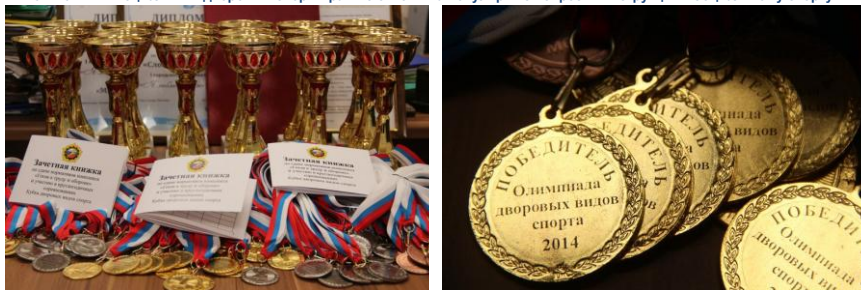
Награды Олимпиады дворовых видов спорта-2014 и зачётные книжки участников Кубка дворовых видов спорта, сентябрь 2014 г. 46

Проведение спортивных соревнований в рамках круглогодичного Кубка дворовых видов спорта 2013/2014 года носило экспериментальный характер, так как впервые было столь интенсивным по количеству проводимых мероприятий и массовости. Эта система доказала свою эффективность и получила дальнейшее развитие и в 2014 – 2015 гг., не только пропагандируя здоровый образ жизни на уровне каждого двора в масштабах целого города, но и став самым массовым, длительным и масштабным спортивным соревнованием в истории Липецка – в нём принимало участие более 6 тыс. человек разного возраста (от 3 до 68 лет) с постоянной тенденцией увеличения количества горожан – любителей здорового образа жизни.