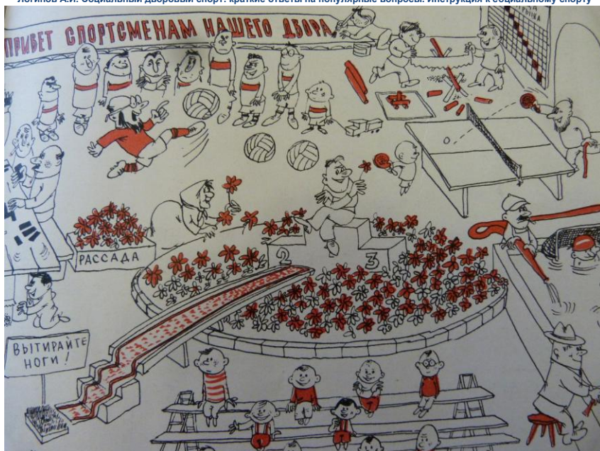
Обложка журнала «Спортивные игры», пропагандирующая дворový спорт, 1962 г. 9

Таким образом, ведущую роль в организации спорта играла государственная политика в сфере идеологического и информационного обеспечения массового спорта, объяснения важности физкультурного движения для страны и национальной безопасности. Принимавшиеся на высшем уровне организационные решения были обязательны для исполнения и содействовали развитию многих видов спорта, чему в значительной степени содействовала советская пропаганда.