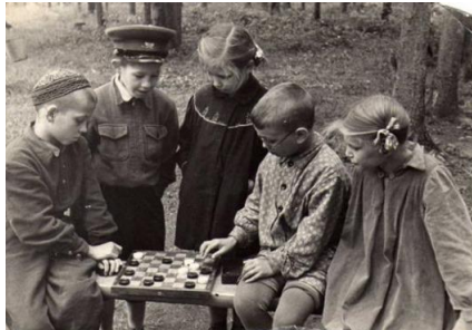
Игра в шашки во дворе, 1950-е годы

Следует отметить, что подвижным всесторонним играм, особенно командным, уделялось исключительное внимание в Советской Армии. Так, в 1955 году издательством Министерства обороны СССР был издан специальный сборник, содержащий описание спортивных игр и развлечений для физической и подготовки воинов Вооруженных Сил СССР.